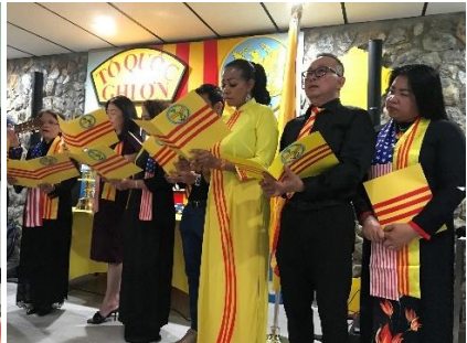
Chủ tịch và Phó CT CĐ khai mạc đêm thắp nến – Các quan khách Mỹ - Đồng Ca của Hậu Duệ VNCH Tampa Bay